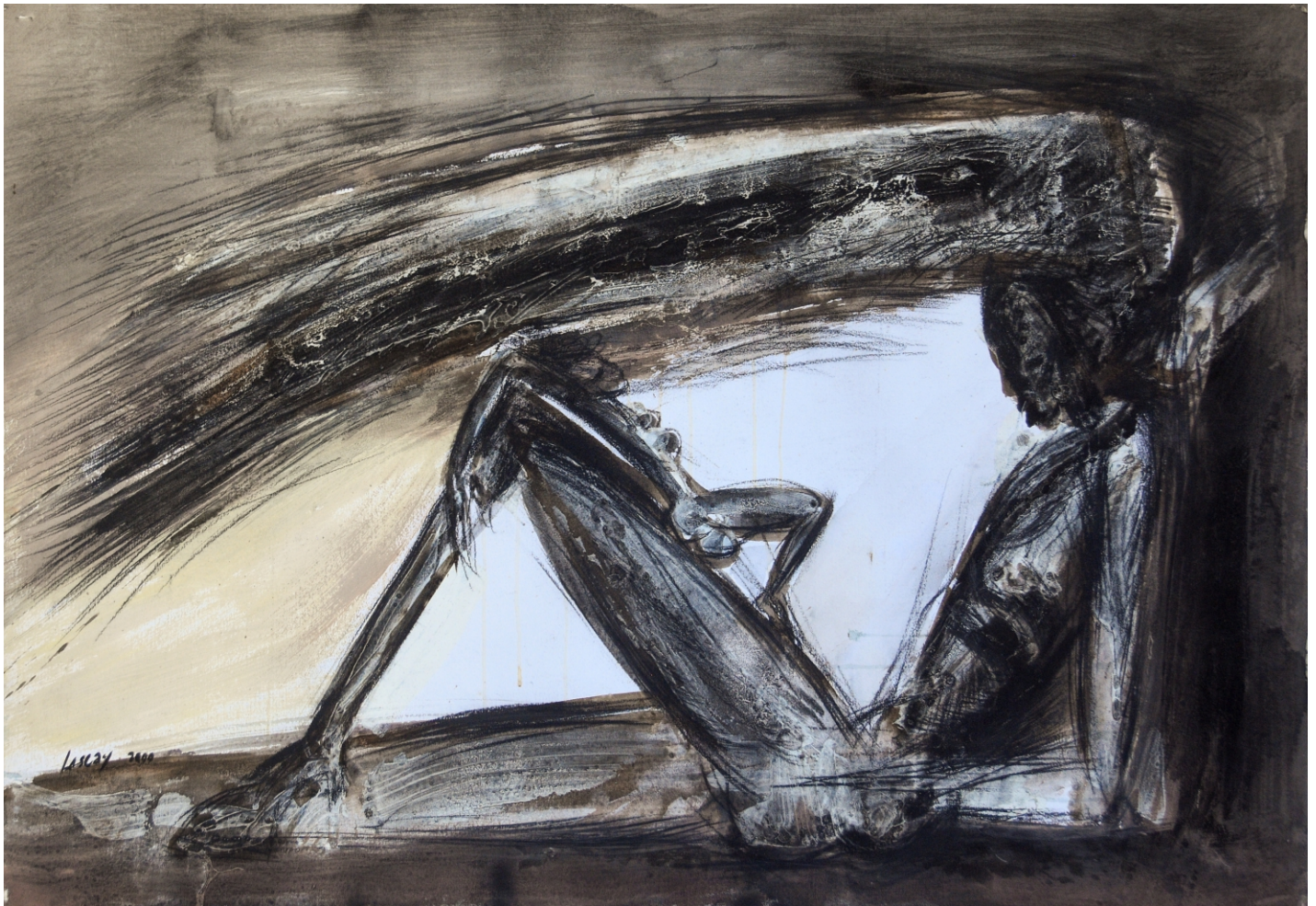
Sueño del Cimarrón dibujo, 2000 técnica mixta sobre cartulina 70 x 100 cm