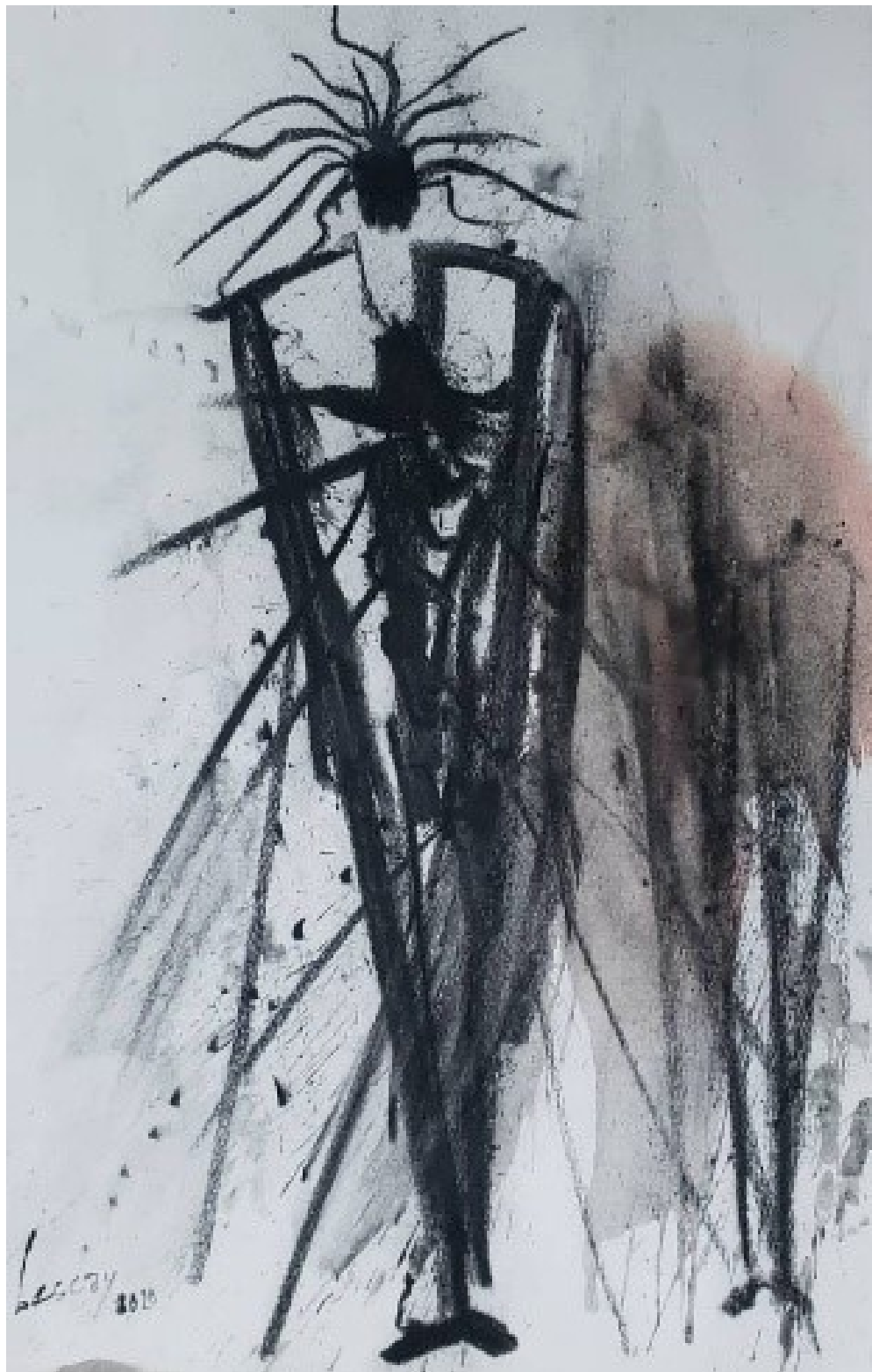
Paisaje Interior pintura, 2020 técnica mixta sobre cartulina 50 x 35 cm