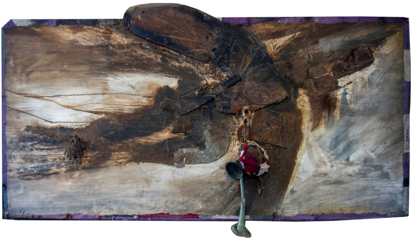
Era un vuelo rasante pintura, 1999 técnica mixta sobre madera 120 x 250 cm