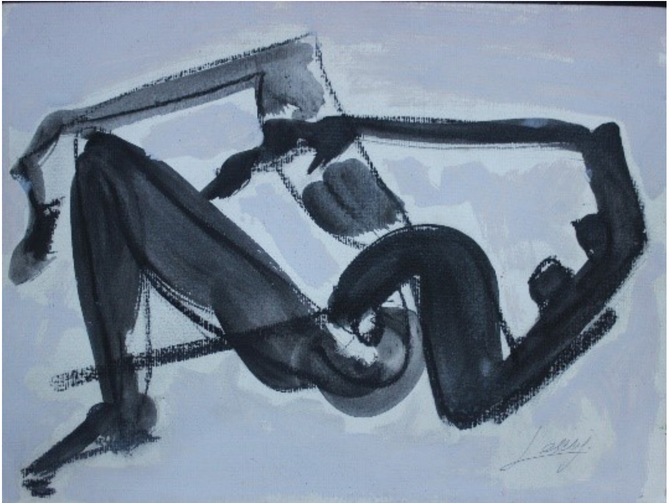
Encontrar pintura, 2020 técnica mixta sobre cartulina 30 x 39,8 cm