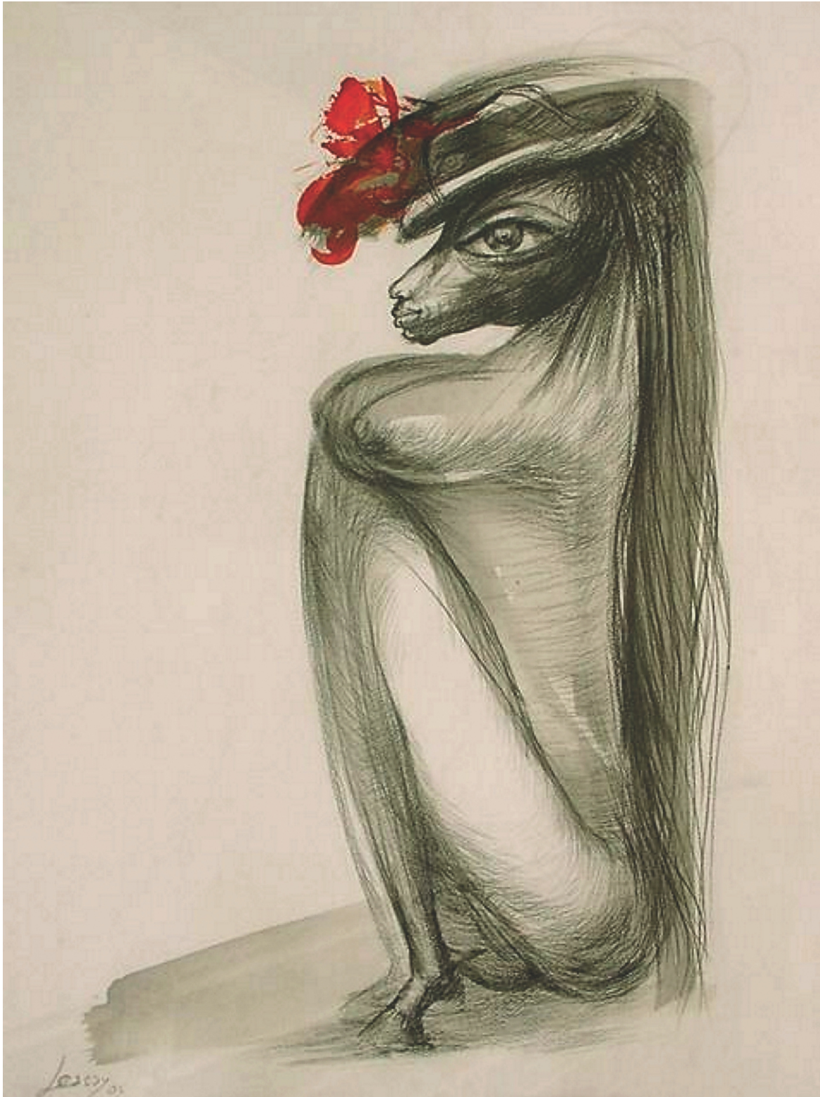
La Caballa dibujo, 2003 técnica mixta sobre papel 70 x 50cm