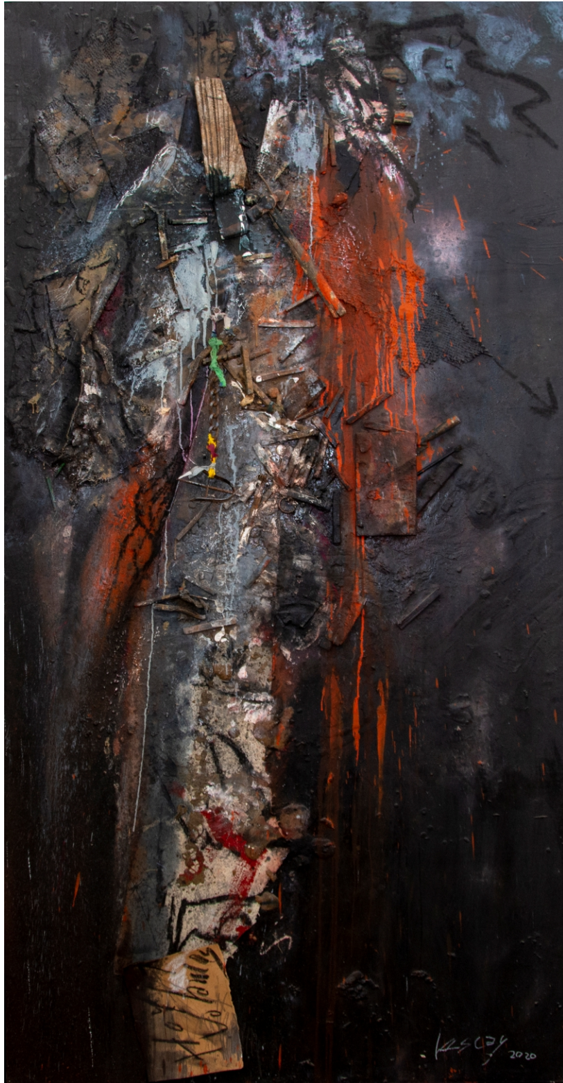
Hoy volamos (Aponte) collage, 2020 técnica mixta sobre madera contrachapada (madera, papel, metal, tela y otros) 245 x 123 cm