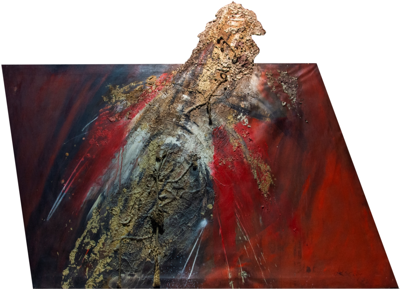
Espíritu en vuelo pintura, 1988 técnica mixta sobre lienzo 200 x 250 cm