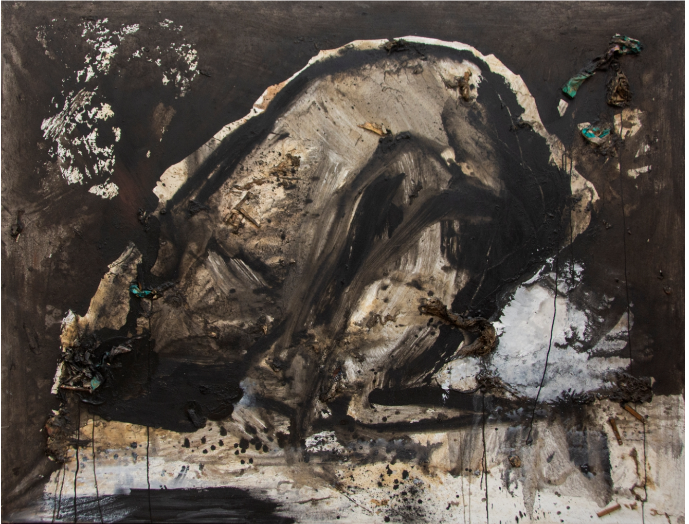
Perdón pintura, 2020 técnica mixta sobre lienzo 158 x 200 cm