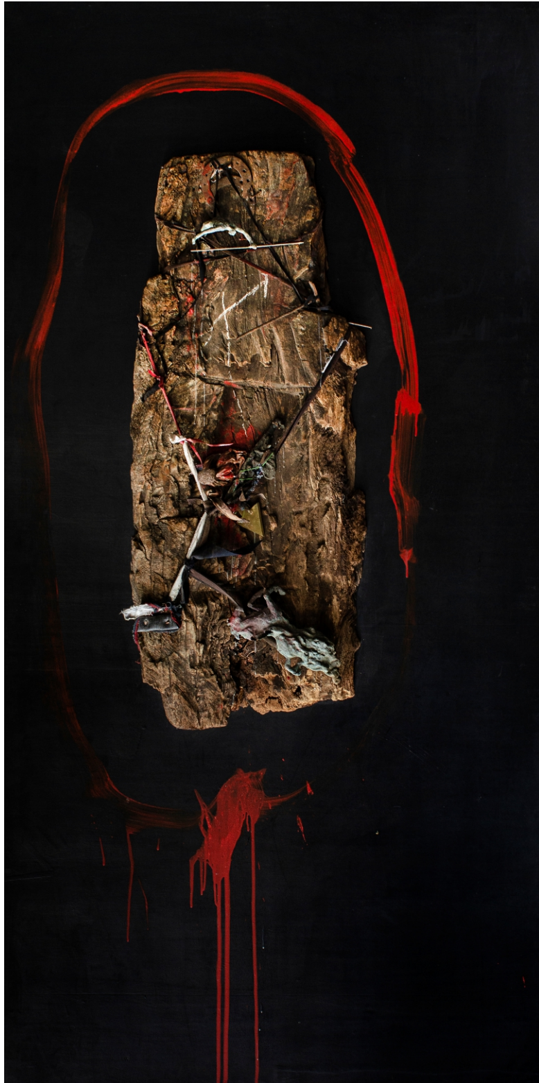
Makuto II pintura, 2020 técnica mixta sobre madera contrachapada 245 x 123 cm