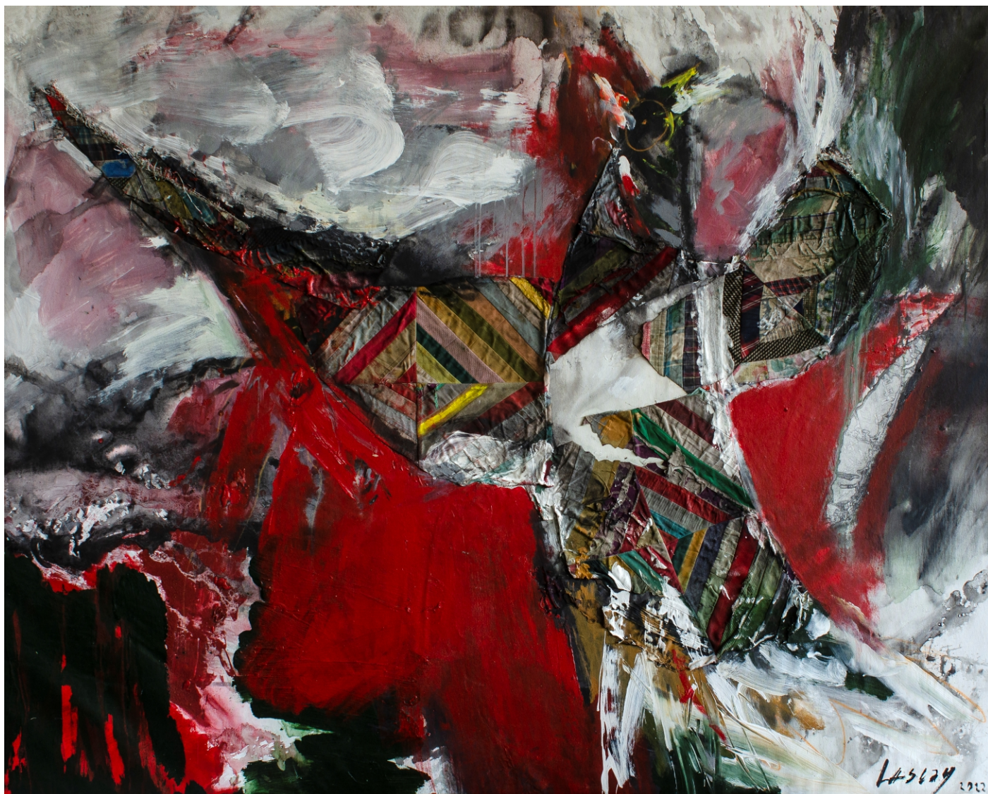
Augurio pintura, 2022 técnica mixta sobre lienzo 161,6 x 203 cm