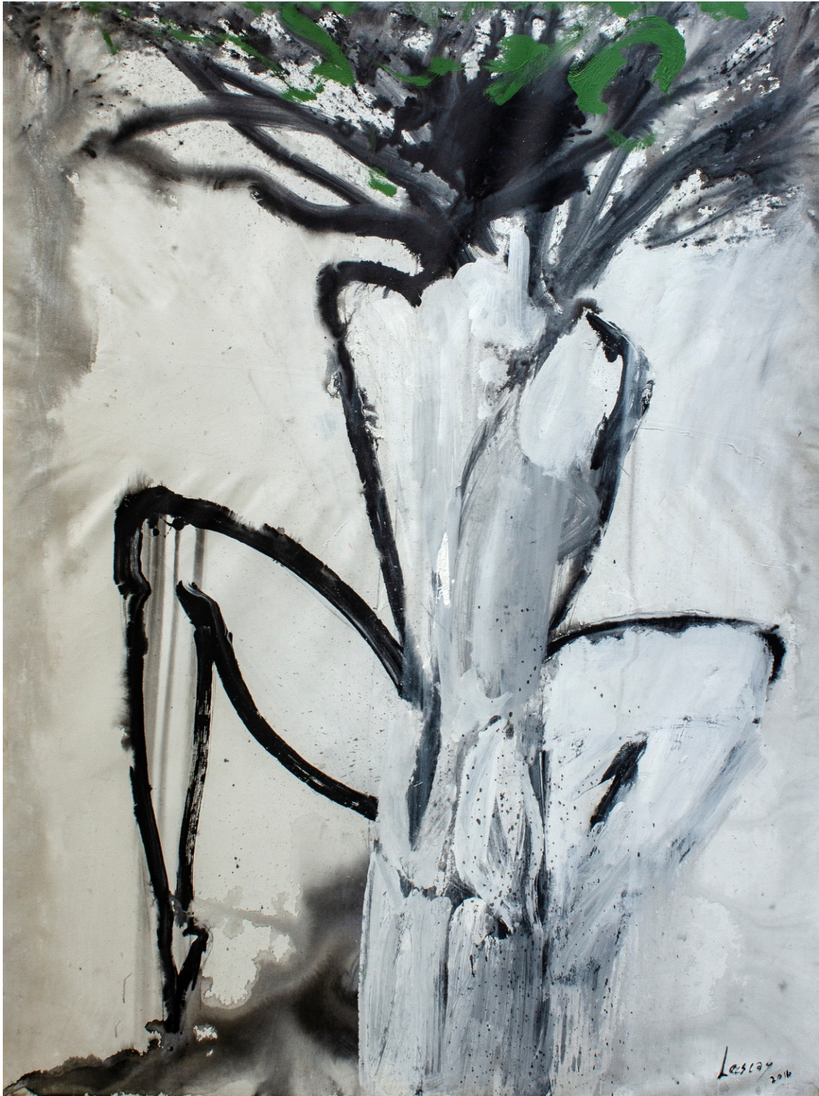
Amar Crecer pintura, 2016 acrílico sobre lienzo 198 x148 cm