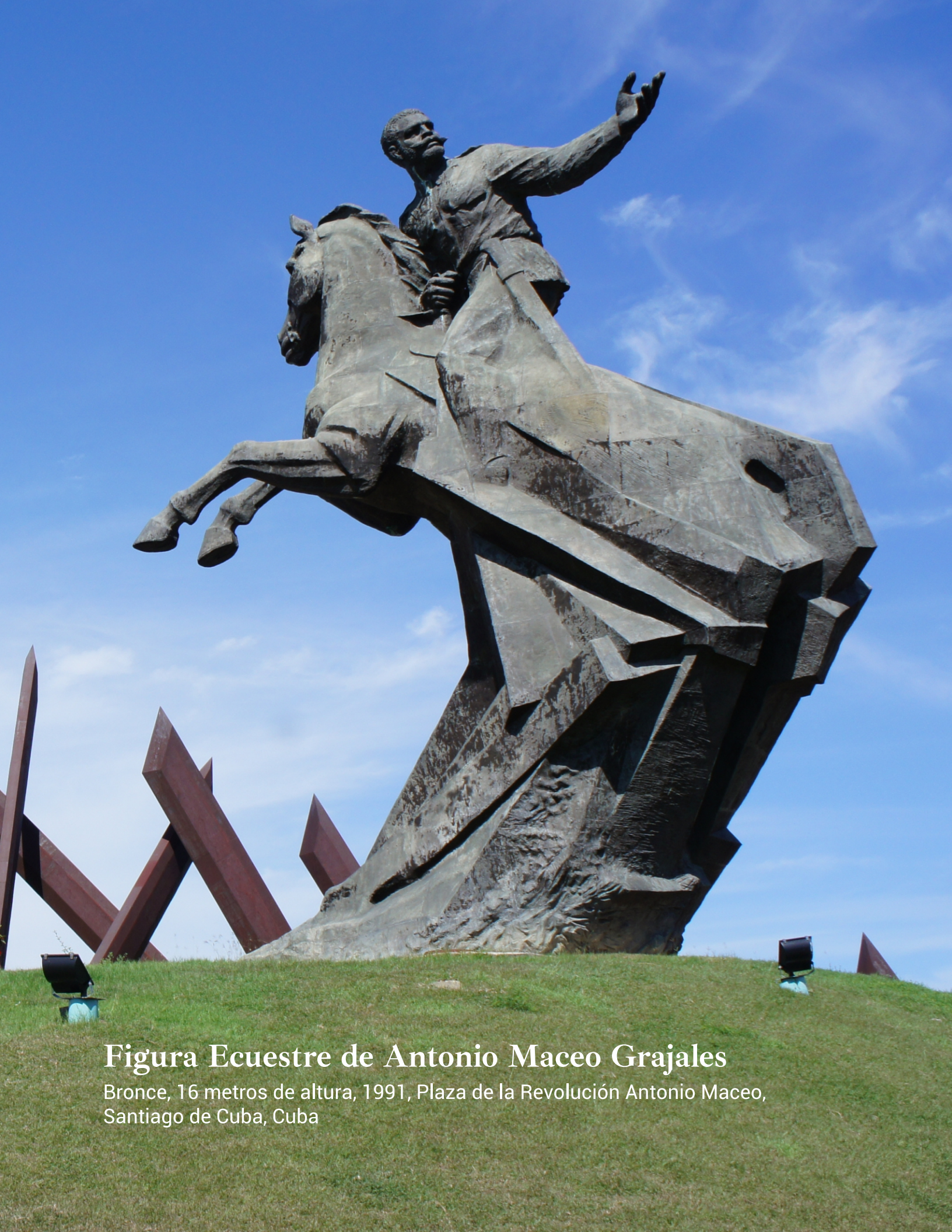
Figura Ecuestre de Antonio Maceo Grajales

Bronce, 16 metros de altura, 1991, Plaza de la Revolución Antonio Maceo, Santiago de Cuba, Cuba