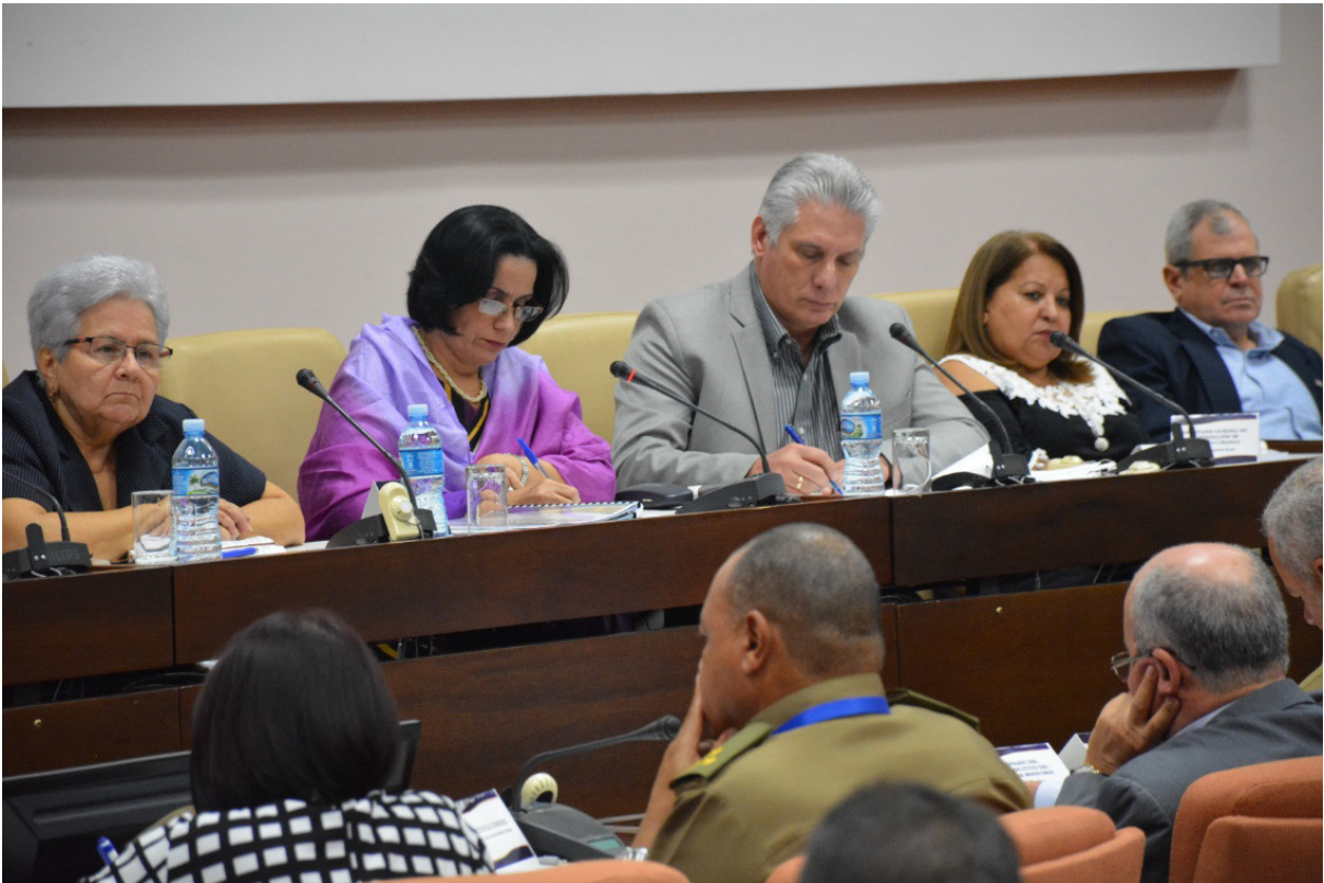
Encuentro de trabajo del Presidente de la República de Cuba, Miguel Díaz-Canel Bermúdez, con el Consejo de Dirección Ampliado de la Fiscalía General de la República.