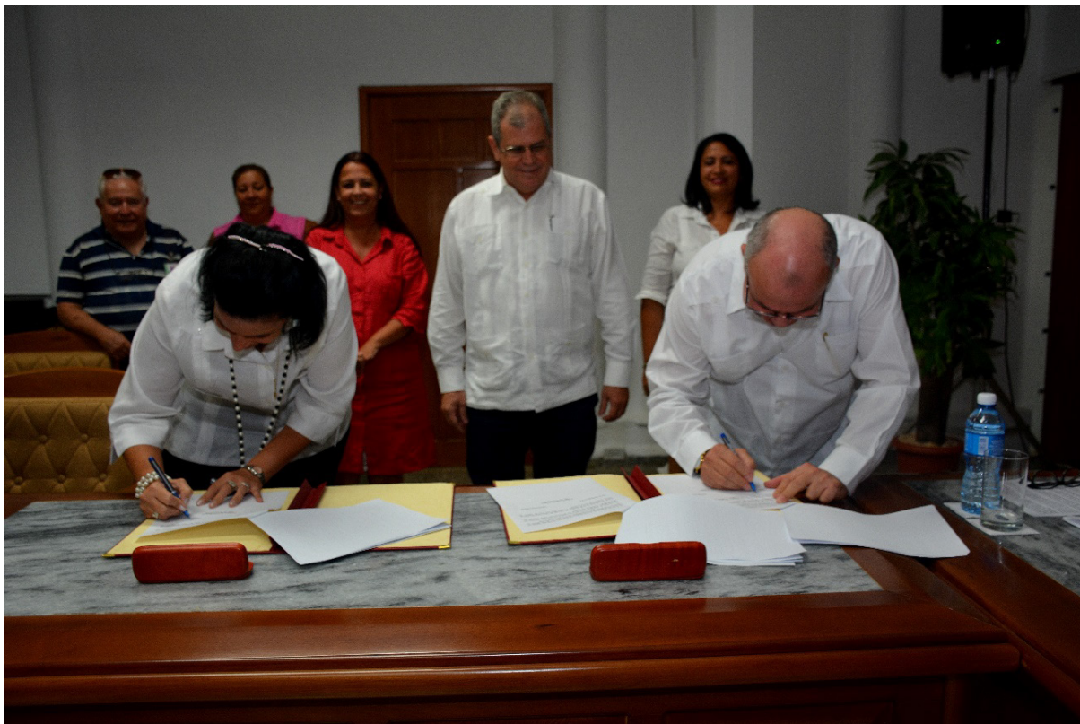
Toma de posesión de Yamila Peña Ojeda como Fiscal General de la República.