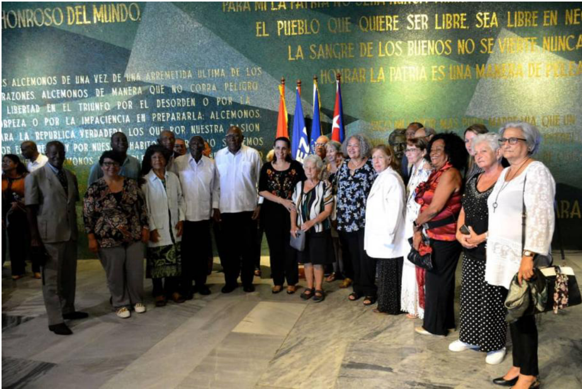
Acto de entrega de la bandera de Proeza Laboral a los jubilados del órgano.